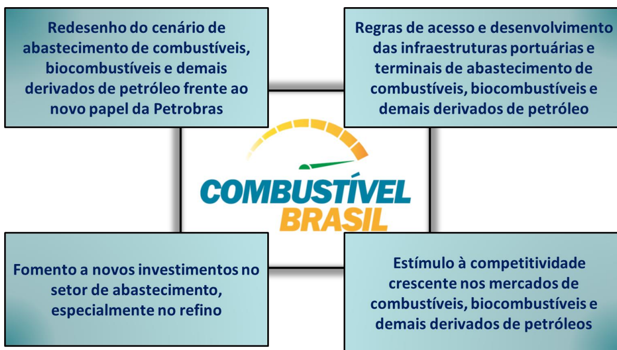
Figura 1 – Os quatro eixos estratégicos

Em seguida, reduziu a termo, sob a forma deste Relatório, os anseios e problemas externados pelos agentes, os quais foram analisados e enquadrados em um dos temas selecionados, de forma alinhada aos eixos estratégicos da Erro! Fonte de referência não encontrada.